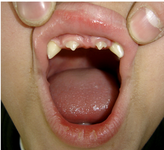
Figure 2. Eruption dentaire conique et incomplète chez son frère âgé de sept ans, également atteint de dysplasie ectodermique anhidrotique.

dromes distincts. Plusieurs classifications ont été proposées. La première est établie en fonction de la présence ou non de quatre signes cardinaux : la trichodysplasie, les anomalies dentaires, l'onchodysplasie et les troubles de la sudation. Avec l'identification progressive des gènes en cause, de nouvelles classifications clinico-génétiques et physiopathologiques ont permis de répartir les dysplasies ectodermiques selon le déficit cellulaire structurel ou fonctionnel en cause [2–4].